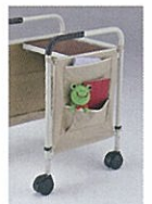
大・小ポケット付き