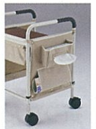
ティッシュBOX・新聞・雑誌入れ付き